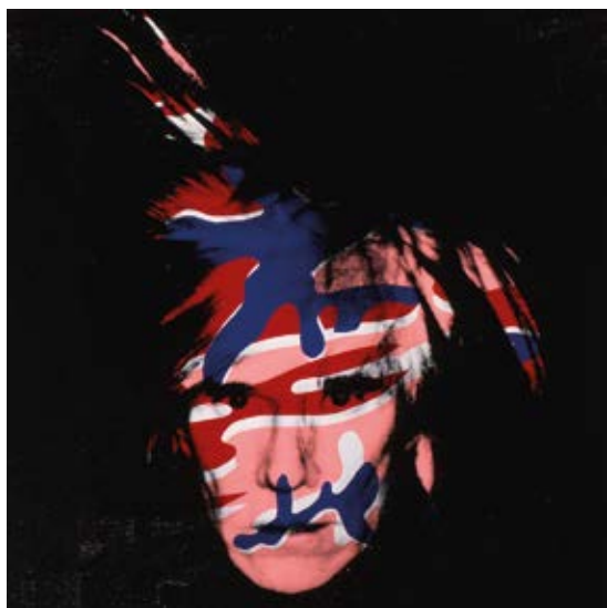
Tentotips ANDY WARHOL