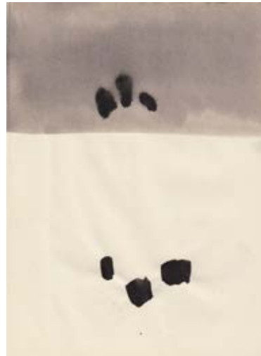
S.T., 25 x 18,5cm, 2011