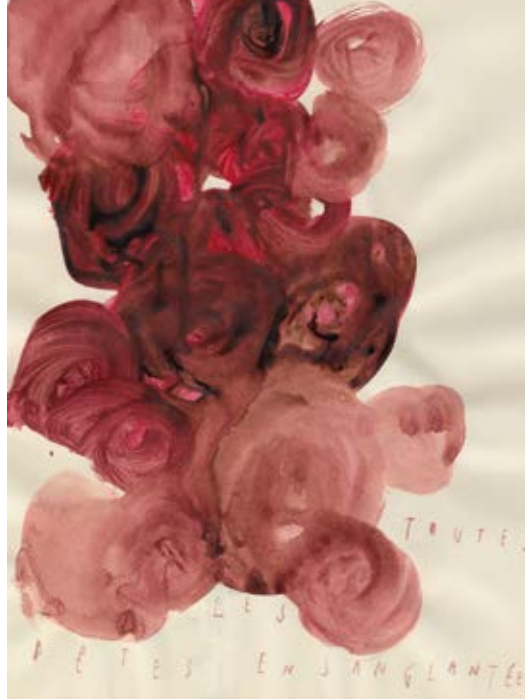
Gesprekken met kunstenaars ARPAÏS DU BOIS