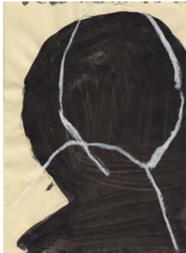
S.T., 25 x 18,5 cm, 2011