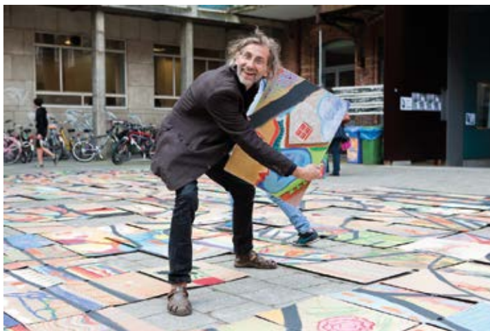
Beeldverslag THE BIG DRAW