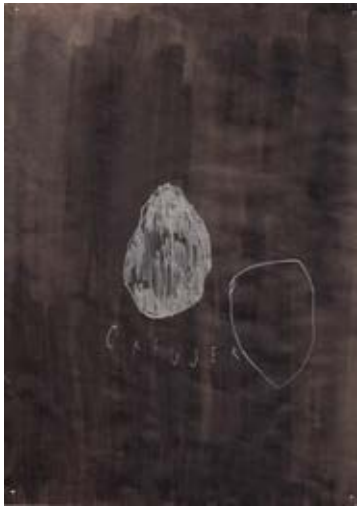
creuser, 25 x 18,5 cm, 2013