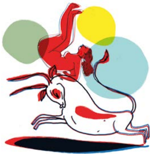
In de kijker GERDA DENDOOVEN