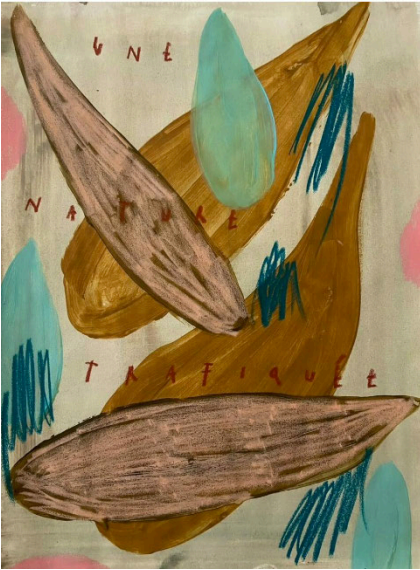
une nature trafiquée, 2024