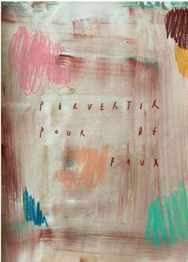
pervertir pour de faux , 2024 © Arpaïs Du Bois

ook een kwestie van tijd maken voor de dingen waar je nood aan hebt, en bij Du Bois is tekenen dat dagelijkse ritueel. “Er gaat geen dag voorbij dat ik niet in mijn atelier kom”, knikt ze. “Soms maak ik één werk, soms meerdere. Ik sta nooit op met een plan, want de dingen die ik teken of neerpen, moeten eerst binnenkomen.”